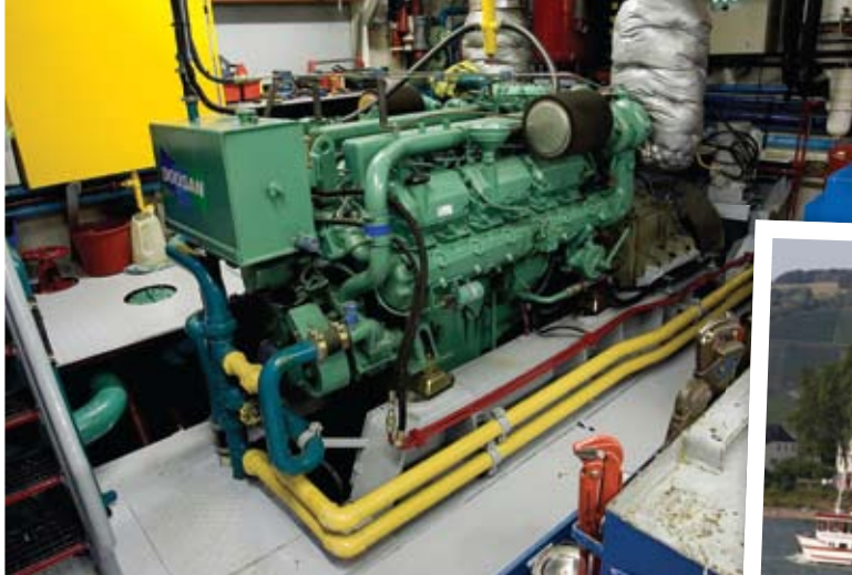
Doosan 4V222TiH marine motor op riviercruiseschip MS Andante